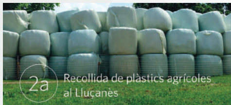
2a Recollida de plàstics agrícoles al Lluçanès

El Consorci del Lluçanès, conjuntament amb els ajuntaments de la comarca, ha organitzat, per segon any consecutiu la recollida de plàstics agrícoles del Lluçanès. Es recollirà film agrícola i sacs de plàstic i paper que es tractaran mitjançant un gestor autoritzat per a la seva recuperació i reutilització. Altres residus no recuperables com cordills, sacs de rafia i reixes es gestionaran com a fracció rebuig i es tractaran al dipòsit controlat d'Orís. L'objectiu principal d'aquest projecte és millorar la gestió dels residus agrícoles al nostre territori i fomentar la cultura de la reducció, reutilització i reciclatge dels residus generats.