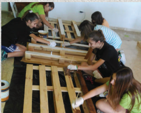
Equip de Govern

Tot això, enmig dels reptes del dia a dia i dels projectes engegats.